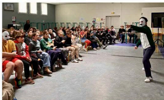
Le spectacle prône la mise en place de cours d'empathie comme ça se fait au Danemark.

Le projet du spectacle a été de donner la parole à celles et