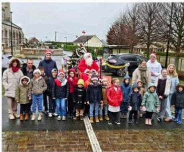
Peu de temps avant les fêtes, les enfants ont profité d'un spectacle et d'une parade de Noël, grâce au comité des fêtes.

Grâce à l'équipe du comité des fêtes, les enfants du village d'Avremesnil ont eu droit à un beau programme d'animations autour de Noël. Rendez-vous avait été donné en tout début d'après-midi dimanche 21 décembre pour participer à la parade de Noël. Le célèbre gros bonhomme vêtu de rouge est arrivé avec un petit tracteur pour mener le groupe composé