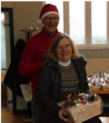
La bonne humeur était de rigueur pour les aînés qui ont récupéré leur colis.

La municipalité de Martigny n'a pas dérogé à la tradition ce samedi 13 décembre, avec la remise de douceurs aux aînés : 42 colis duo et 26 individuels ont été distribués par les élus, vêtus en conséquence. Cette distribution était accompagnée d'une pause-café avec friandises très appréciée, car elle a donné l'occasion d'échanger avec les élus.