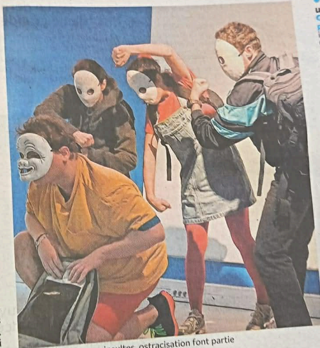
Violences, menaces, insultes, ostracisation font partie du quotidien des élèves harcelés.

leur, des souffrances, des chemine-ments cauchemardesques. Un fragment du long inventaire des ados conduits au suicide fait office de conclusion : « J'étais dégoûté de moi-même... Mes parents n'y voyaient rien... J'avais des pulsions de vengeance... Je me sens vide... J'en peux plus... À l'école personne